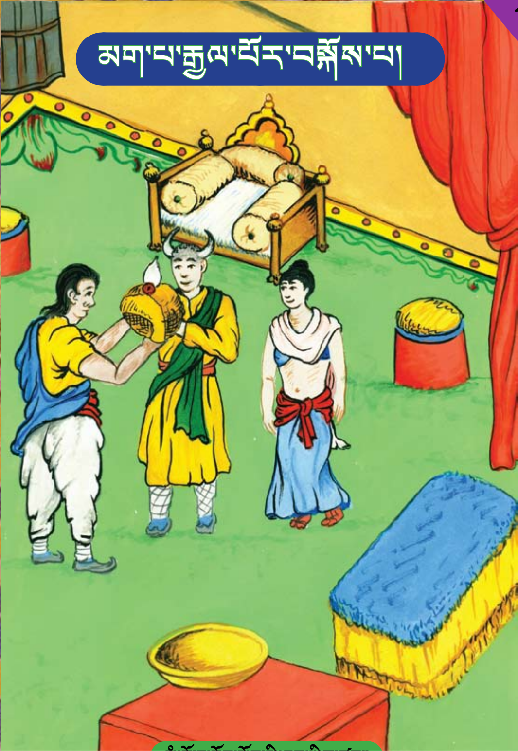
སི་རྩོ་ཏ་བོད་སློབ་སྦྱི་ཁྱབ་ཡིག་ཚང་།